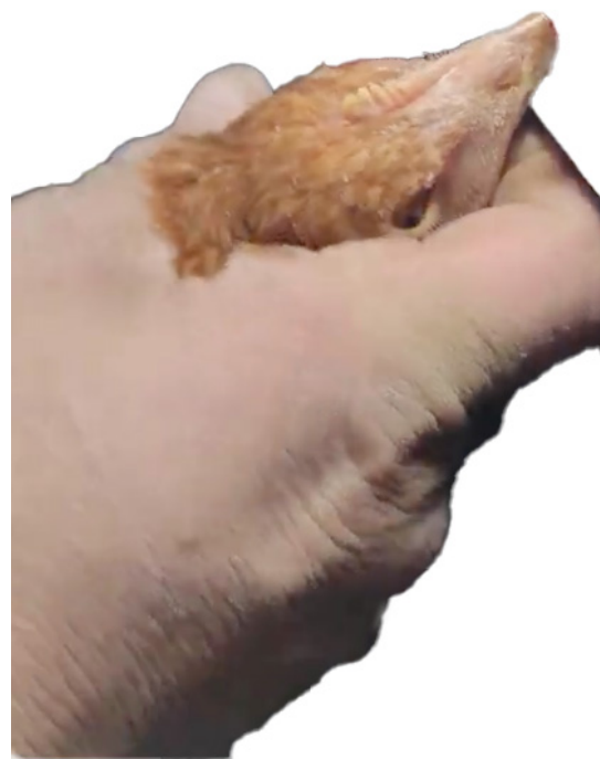
Corte Superior de Pico