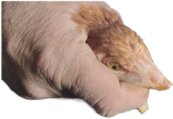
Corte completo de Pico