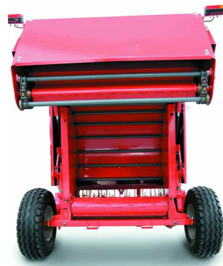
Camara con puerta abierta Chamber with open rear door

Enganche regulable con posibilidad de variación de la altura de la máquina para la adaptación a los diferentes tipos de tractor.