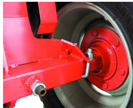
Eje rueda regulable Adjustable wheel axle