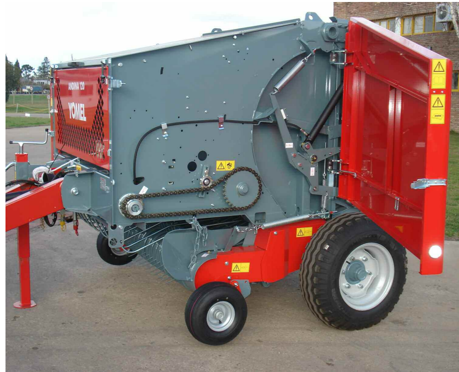
Visual carter lateral View side carter