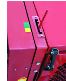
Palanca control presion Pressure bar

Adjustable draw-bar with the possibility to change the height from the ground to the machine's body for adjusting it to the different types of tractor.