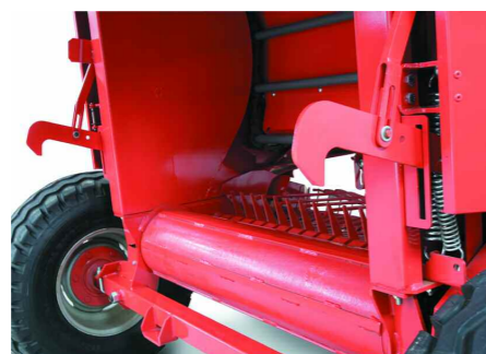
Ganchos cierre apertura puerta Hooks opening/closing rear door

Recolector (Pick-up) de 1,70 m y 2 m de ancho equipado de dos sinfines para una recogida veloz y elevada sobre cualquier tipo de hilera de pasto.