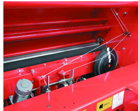
Atador a hilo Net binder