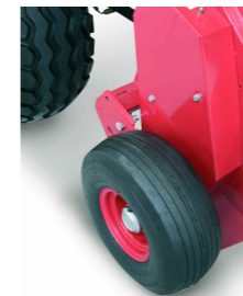
Ruedas en goma Rubber wheels