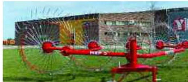
Rastrillo de entrega lateral HRP-5 / HRP-5 Side delivery rake