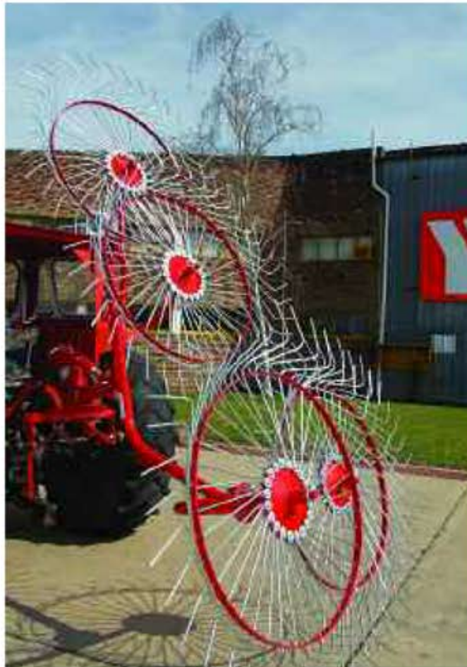
Rastrillo HRP-4 posición de transporte. Ancho de transporte 1,40 metros.