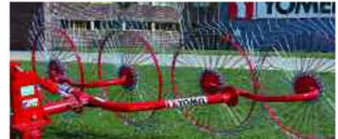
Rastrillo de entrega lateral HRP-4 / HRP-4 Side delivery rake